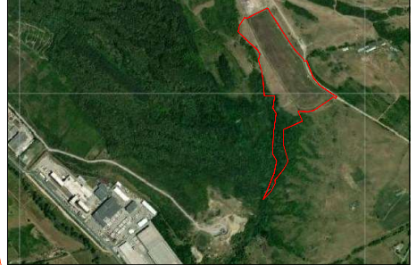
Plan de incadrare in zona Scara 1:10000